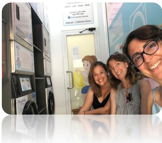
La domenica pomeriggio in lavanderia.