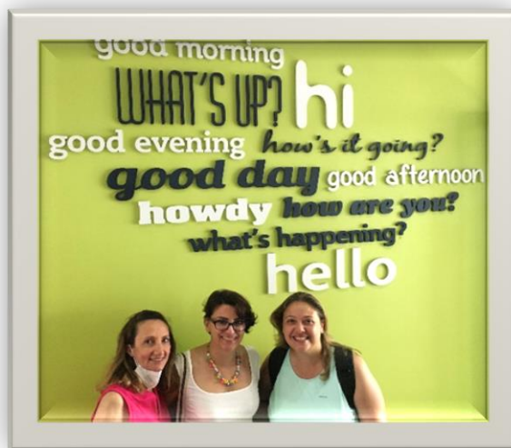
Le uscite didattiche